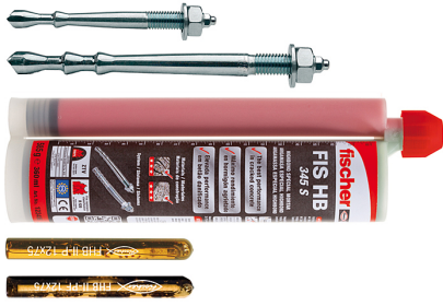
Ancrage haute adhérence FHB II