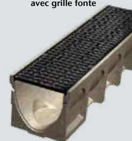
Caniveau Basicdrain 200 avec grille fonte