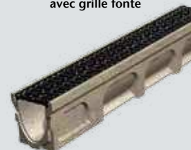
Caniveau Basicdrain 100 avec grille fonte