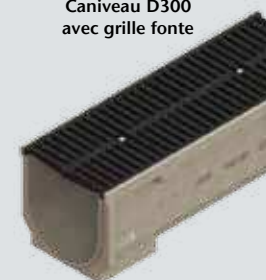
Caniveau D300 avec grille fonte