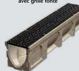
Caniveau Basicdrain 150 avec grille fonte